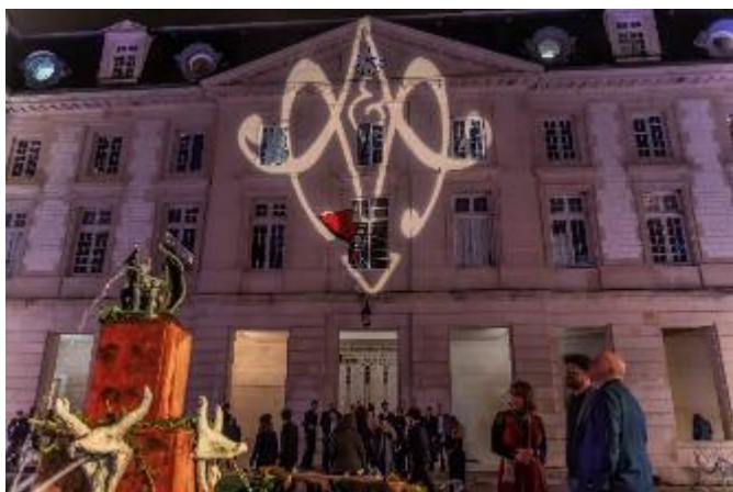
La cour d'Honn's avec sa Fontaine

A minuit, dans la cour des At's un spectacle de jeu de lumière avec des cracheurs de feu et le traditionnel feu d'artifice qui symbolise l'élévation de la nouvelle Promotion.