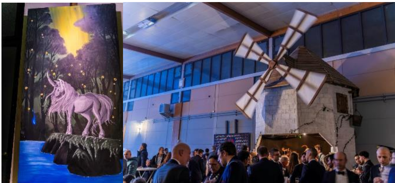
Un moulin avec ses ailes en mouvement