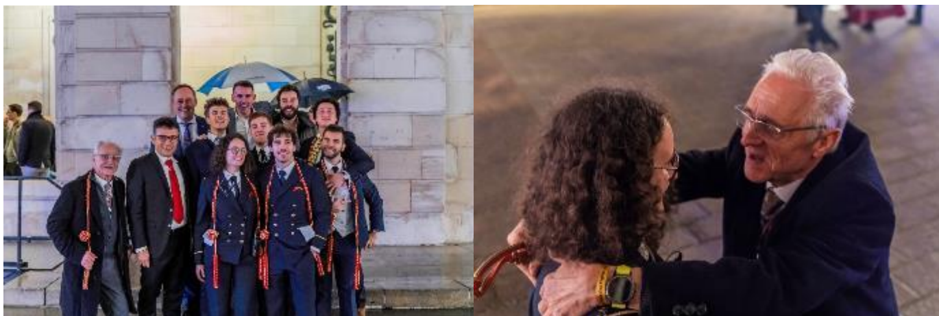
Les Anciens GAF prêts à (re)baptiser Végéboeuf