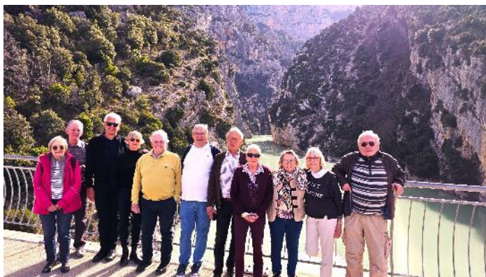
Les onze cheveux blancs, ou presque de la Ch 66 prêts à sauter du pont !