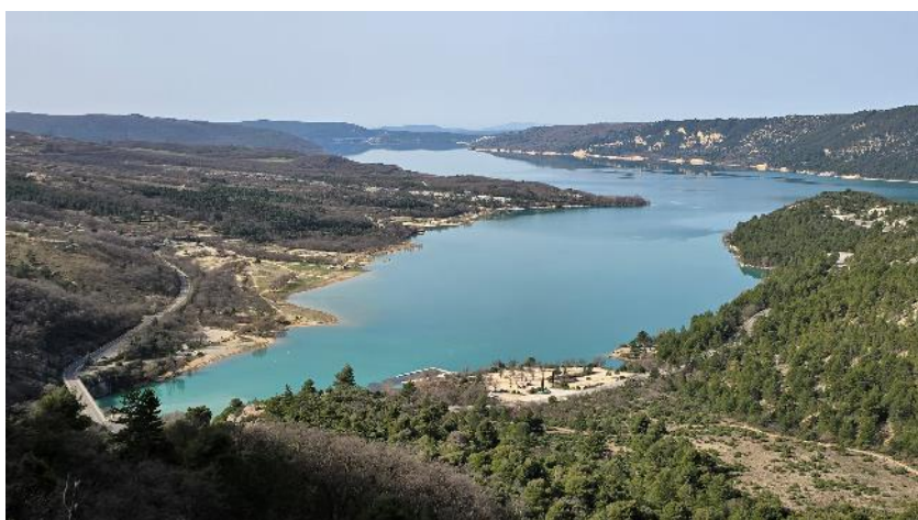
Le lac de Sainte Croix, alimenté par le Verdon avec une centrale hydro-électrique en aval.