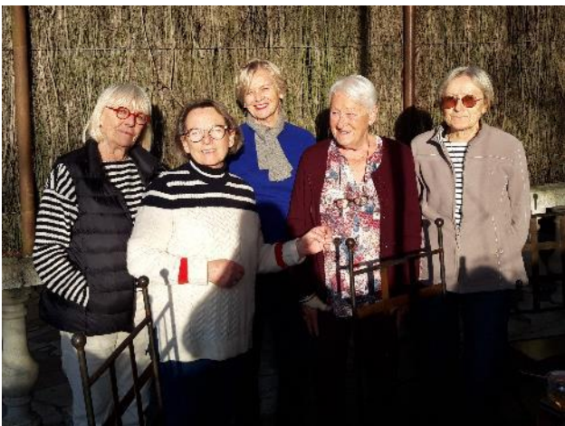
Merci mesdames de nous avoir accompagnés.

Arrivée au domaine de Majastre pour dire au revoir à la guide. Puis nous nous séparons, certains écrasant furtivement une larme coulant le long de leur joue poupine, mais étant certains que bientôt une prochaine sortie nous réunira et nous enchantera à nouveau.