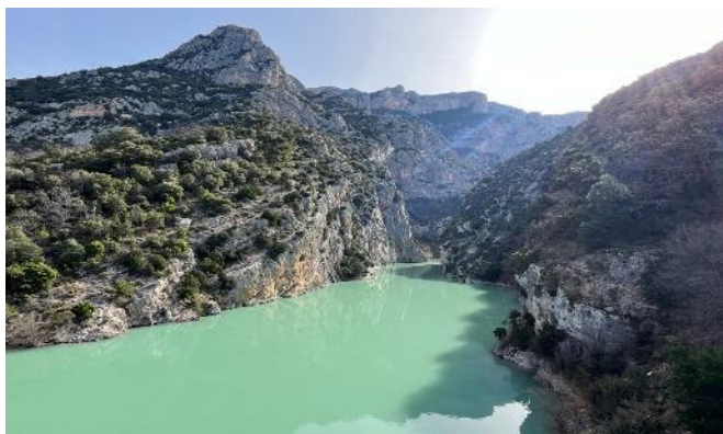
Arrivée du grand canyon du Verdon.