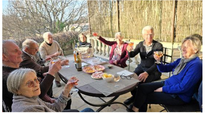
Pour nous en remettre nous avons démarré par un apéritif amené par notre camarade Jade

Nous avons eu une pensée pour nos camarades absents de dernières minutes, les Ozorm's et les Bobbys