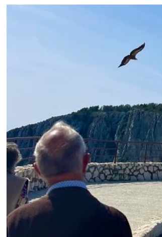
Nous pouvons également regarder le vol silencieux et majestueux des vautours « réimplantés dans la région depuis quelques années ».