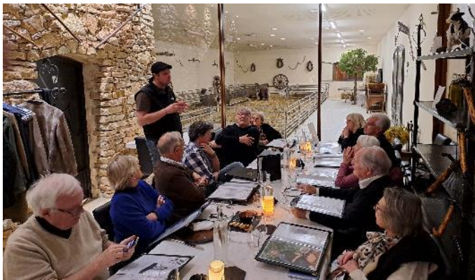
Auditoire attentif aux explications du patron sauf un djeun's sur son portable.

Un discours du patron du restaurant, sur la façon de cultiver, ramasser et vendre les truffes puis nous sommes passés aux choses sérieuses, c'est-à-dire le menu Passion Truffe.